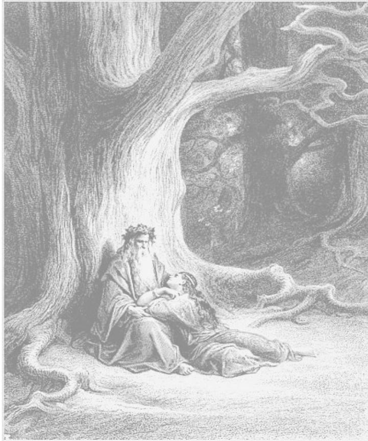
GUSTAVE DORÉ (1832-1883) VIVIANE ET MERLIN, 1868